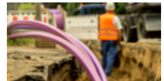
12 tot 14 bar: Inblazen van kabels en boren