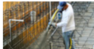
7 tot 12 bar: Spuitsbetontoepassingen