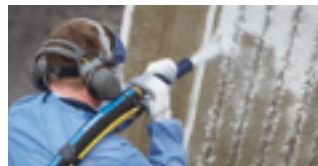
8,6 tot 10 bar: Zandstralen