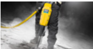
7 bar: Handgereedschap