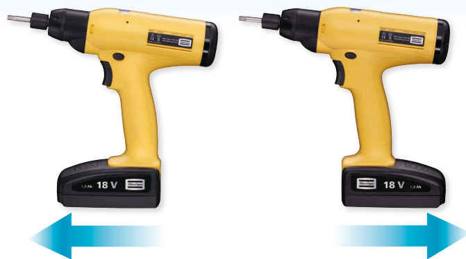
Optimale Zugänglichkeit durch variable Akku-Position

Bei BCP- und BCV-Schraubern gibt es weder Kabel noch Schläuche. Und die Wendeakkus lassen sich für eine noch bessere Zugänglichkeit in zwei Richtungen aufschieben.