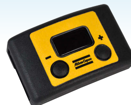
Speed Setting Unit

Das Werkzeug schaltet automatisch beim voreingestellten Drehmoment ab. Wenn die Verschraubung in Ordnung ist, wird dies durch eine grüne LED am oberen Teil des Werkzeugs angezeigt. Ist die Verschraubung nicht in Ordnung, macht eine rote LED darauf aufmerksam. Das LED-Licht zeigt außerdem den Akkuladestatus an und warnt bei niedrigem Ladezustand. Darüber hinaus kann ein Summer aktiviert werden, der zusätzlich noch eine akustische Rückmeldung gibt. Diese Funktionen bestätigen das Verschraubungsergebnis und geben dem Werker Sicherheit.