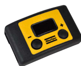
Speed Setting Unit