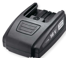
Geringes Gewicht durch Flat-Pack-Akku