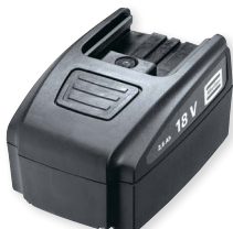
Doppelt so lang arbeiten mit dem Big-Pack-Akku