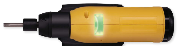
Direkte Rückmeldung durch große LEDs