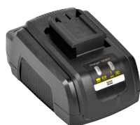
Multicharger (18 V - 36 V)